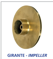
GIRANTE - IMPELLER